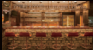
Czech Republic チェコ