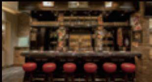
United Kingdom イギリス Asia アジア